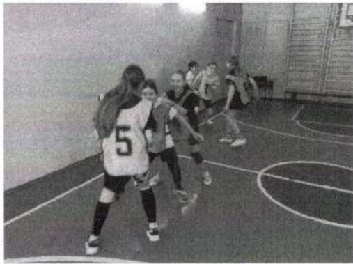
Игра «Коршун, насадка и цыплёнок»

Такие игры, как «Коснись мяча», «Поймай мяч» способствуют развитию таких основных баскетбольных навыков, как умение коммуницировать с партнером, выполнять движения и действия синхронно, перемещаться в правильной стойке, уберегать мяч от потери, переключаться из выжидательной в активную защитную стойку.