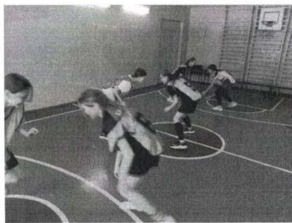
Игра «Пятнашки коленей»