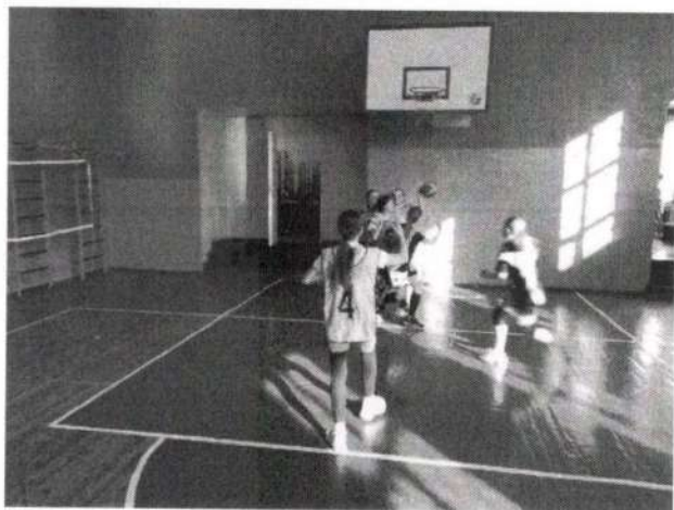
Игра «5 передач»