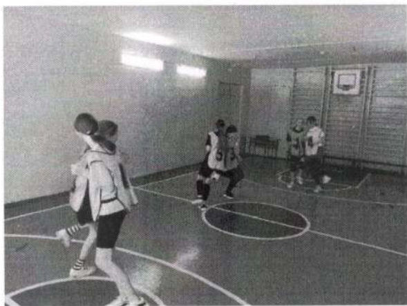
Игра «Бой петухов»

К соревновательной-игровой деятельности обучающихся на тренировочном занятии можно отнести различные эстафеты, игровые упражнения, и непосредственно сами игры. Например, для решения двигательных задач на начальном этапе обучения, в том числе в качестве разминки, можно использовать такие игры, как «Бой петухов», «Пятнашки коленей», «Коршун, наседка и цыпленок» (ссылка на демонстрационное видео упражнений – в конце материала).